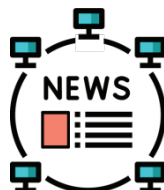
EDITORE DI UN NETWORK DI SITI E QUOTIDIANI ONLINE