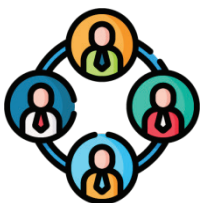
COMUNICAZIONE, PR E RELAZIONI ISTITUZIONALI

Svolgiamo un'azione costante di comunicazione, di influence campaign che, assieme all'organizzazione di eventi, migliora il posizionamento delle aziende e ne accresce la reputazione nella community italiana dei decisori, degli influencer e degli esperti del settore.