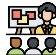
EVENTI, MEETING, WORKSHOP